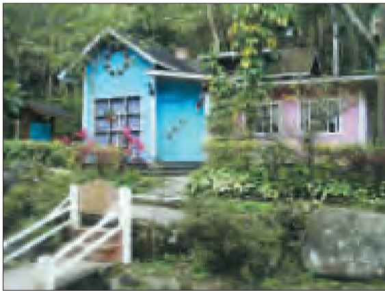
苗栗县栗田庄民宿。

●近日,佰程旅行网重启“印象日本”旅游产品,主要覆盖日本关西地区,价格下降达50%,其中日本一地五日品质游价格为4080元/人。(马青春) ●山东泰安“八百里水泊”唯一遗存水域——东平湖景区近日推出高考生优惠活动:持本人高考准考证,可以20元游览水泊影视城(原价60元),10元游东平湖大寨。(马青春) ●7月16-17日,“第三届中国和静巴音布鲁克天鹅湖国际马术耐力赛”将在新疆和静县拉开帷幕。(马青春)